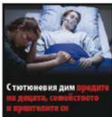
Стюнопушеия дим вредите на децата, семейството и приятелите си