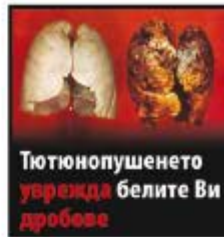
Тютюнопушенето уврежда белите Ви дробове