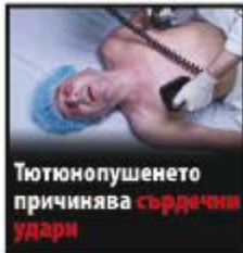
Тютюнопушенето причинява сърдечни удари