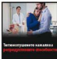
Тютюнопушенето намалява репродуктивните способности