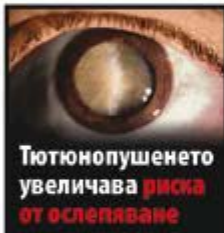
Тютюнопушенето увеличава риска от ослепяване