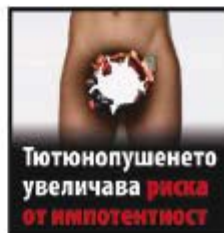
Тютюнопушенето увеличава риска от импотентност