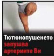
Тютюнопушенето запушва артериите Ви