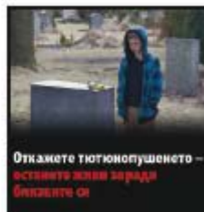
Откажете тютюнопушенето – останете живи заради близките си