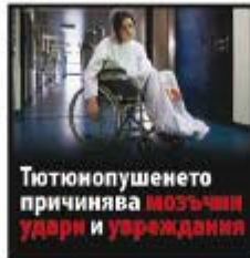
Тютюнопушенето причинява мозъчни удари и увреждания