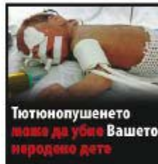
Тютюнопушенето може да убие Вашето неродено дете