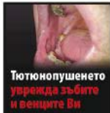
Тютюнопушенето уврежда зъбите и венците Ви