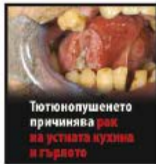
Тютюнопушенето причинява рак на устната кухина и гърлото