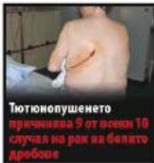
Тютюнопушенето причинява 9 от всеки 10 случая на рак на белите дробове