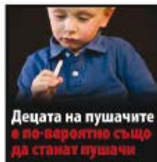
Децата на пушачите е по-вероятно също да станат пушачи